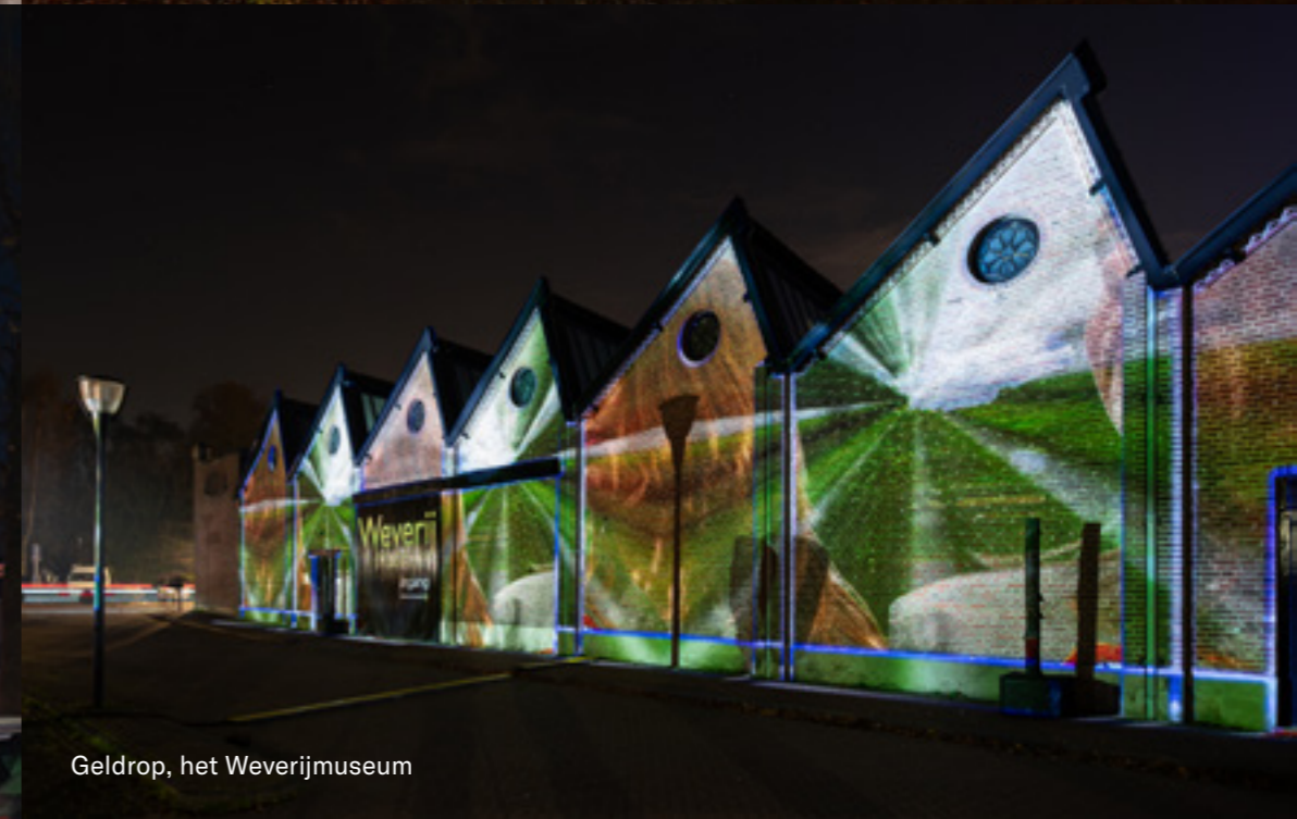
Geldrop, het Weverijmuseum