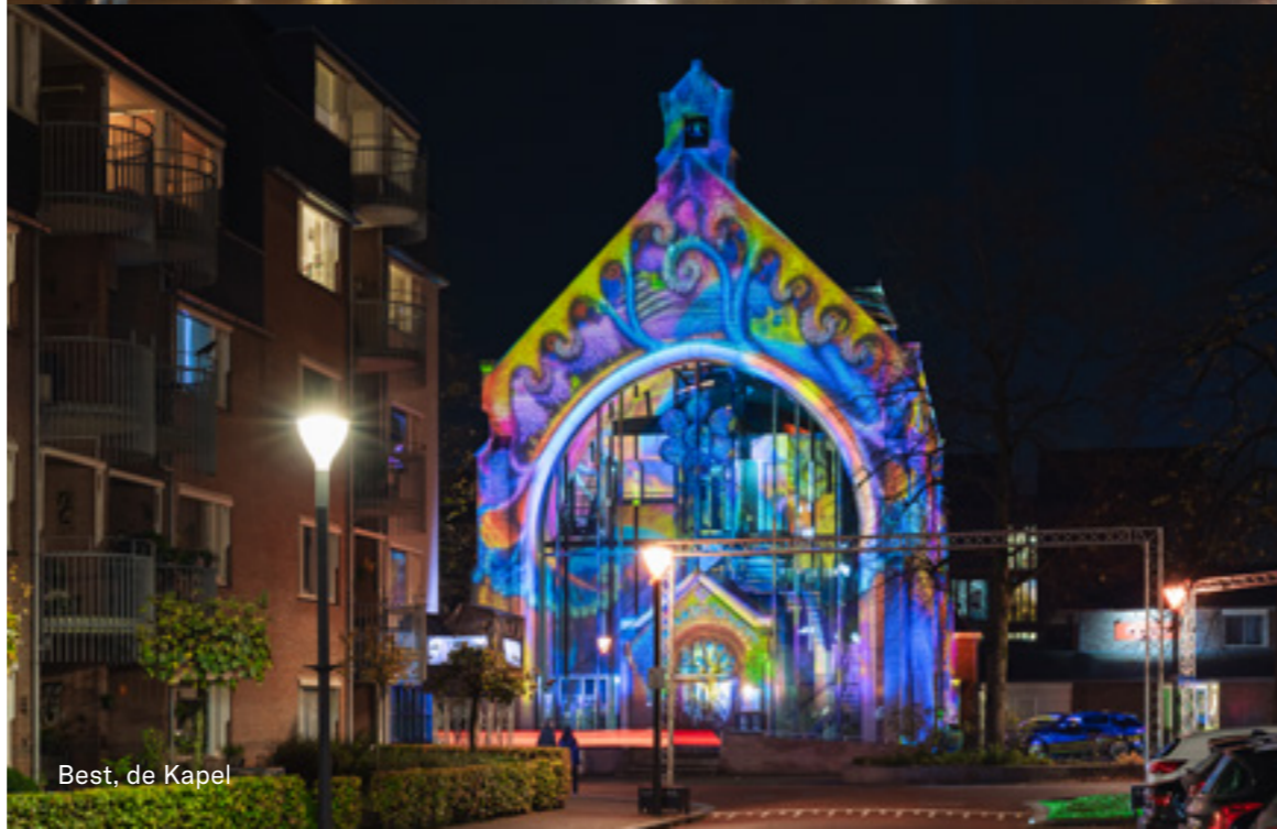
Best, de Kapel