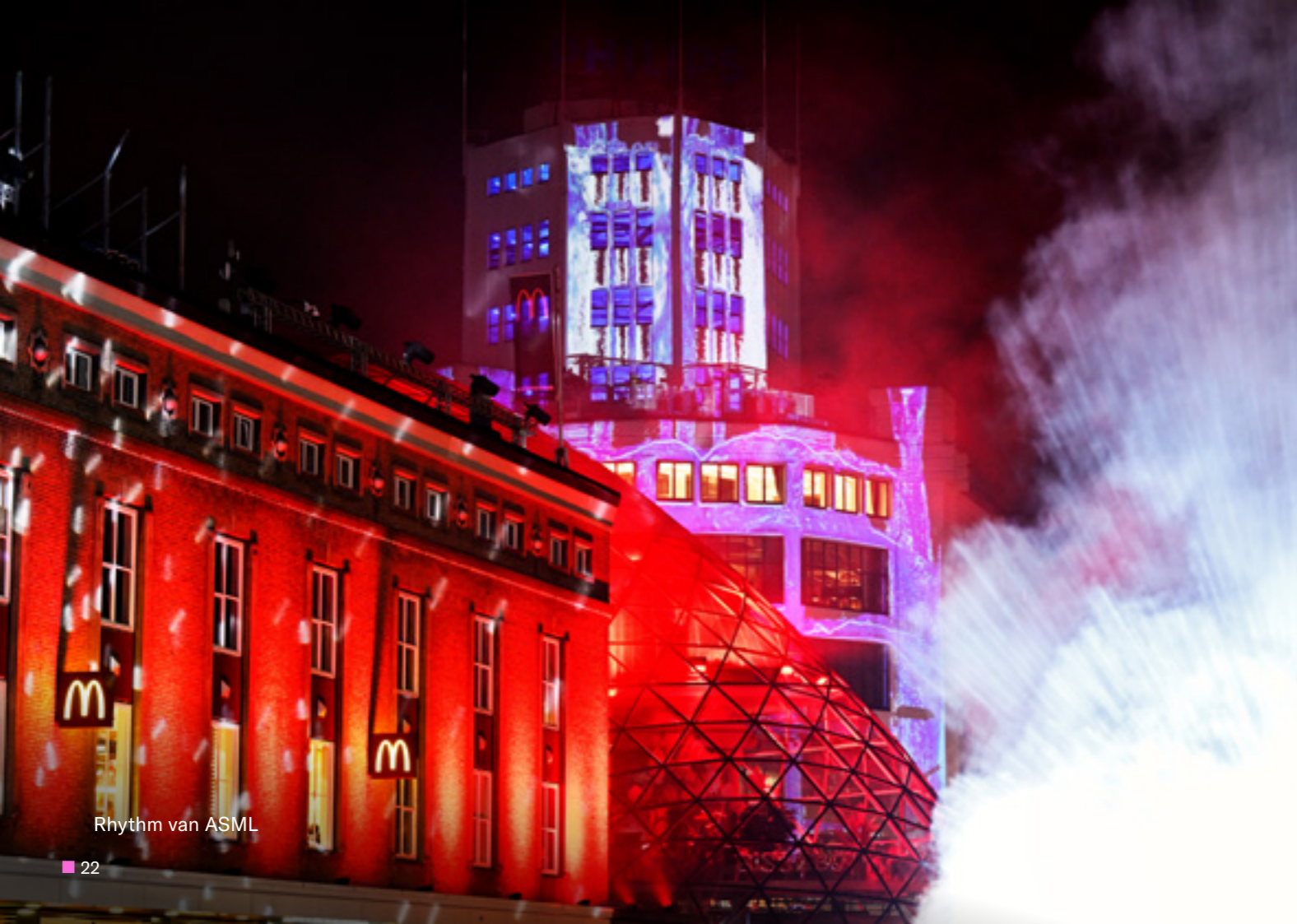
Rhythm van ASML