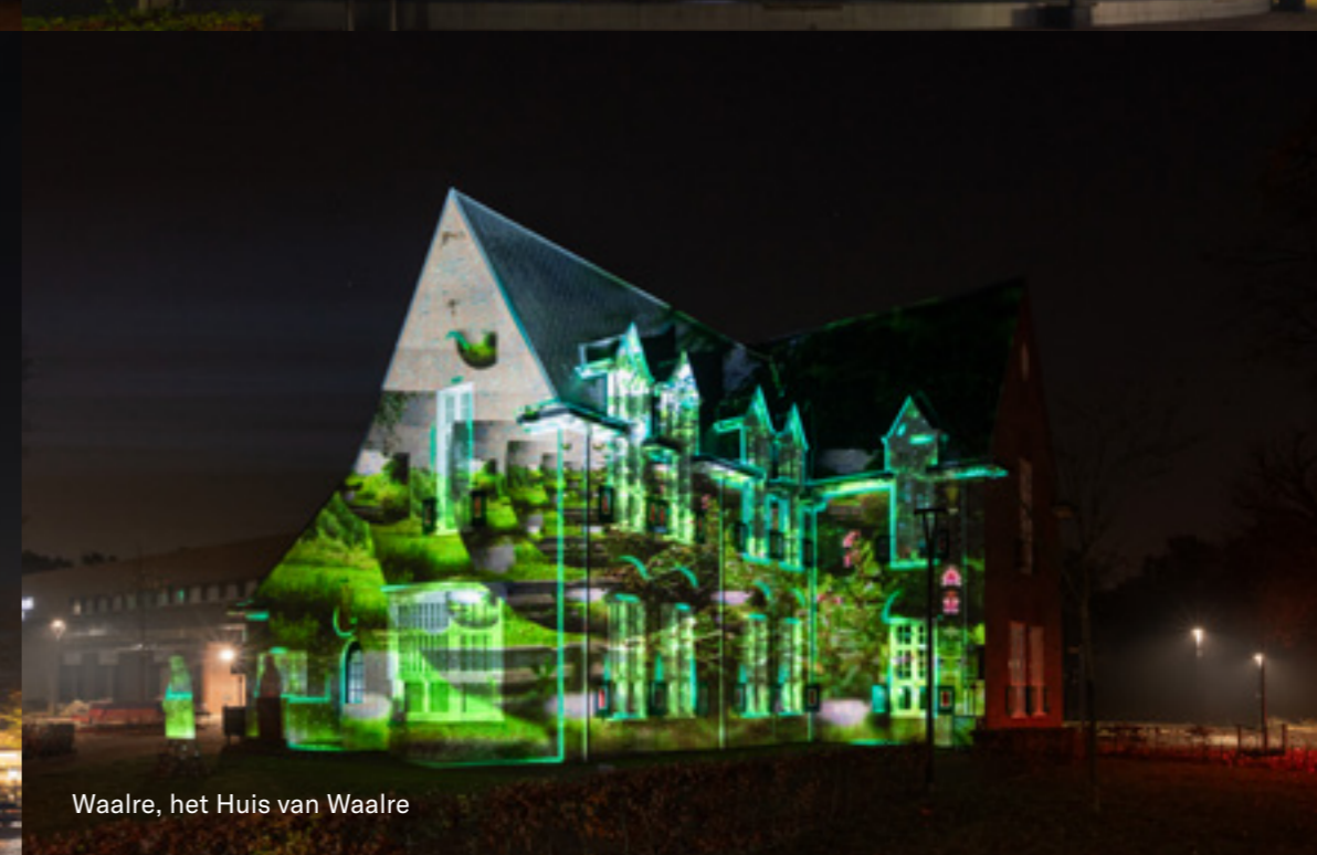
Waalre, het Huis van Waalre