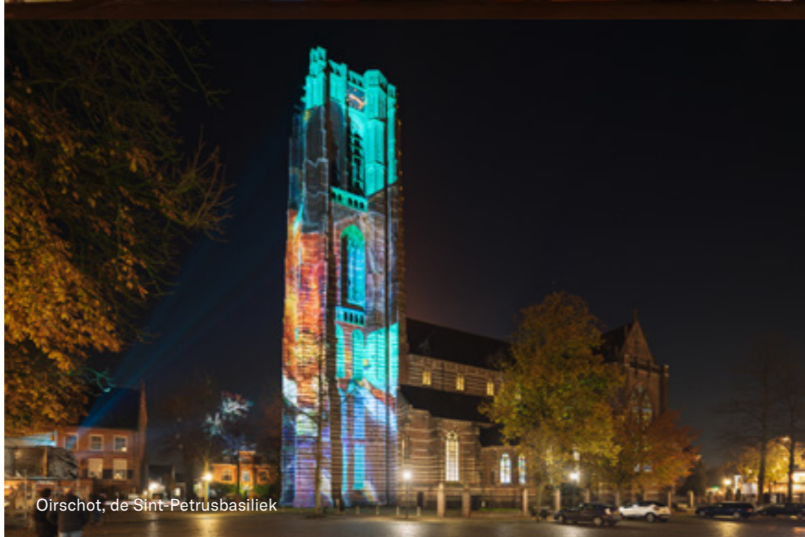
Oirschot, de Sint-Petrusbasiliek