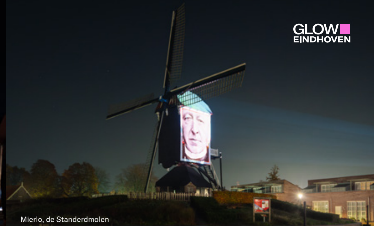
Mierlo, de Standerdmolen