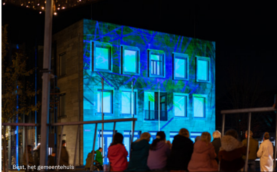
Best, het gemeentehuis

GLOW's ambitie om nog meer mensen aan elkaar te verbinden wordt verwezenlijkt door middel van de regio-projecten. Door het organiseren van kleine GLOW-evenementen in de gemeenten krijgen ook dorpsbewoners hun eigen festival, waardoor het nog meer van de mensen wordt. GLOW hoopt hiermee gezamenlijke trots aan te wakkeren en de sociale cohesie te versterken. Terwijl voor sommigen GLOW Eindhoven te massaal is, brengen de GLOW-edities in de dorpen licht naar mensen die niet naar de stad kunnen of willen komen. Zo ging Het Schaduworgel (winnaar van de Talent Award 2022) langs alle dorpen om een lichttheater te geven in verzorgingstehuizen.