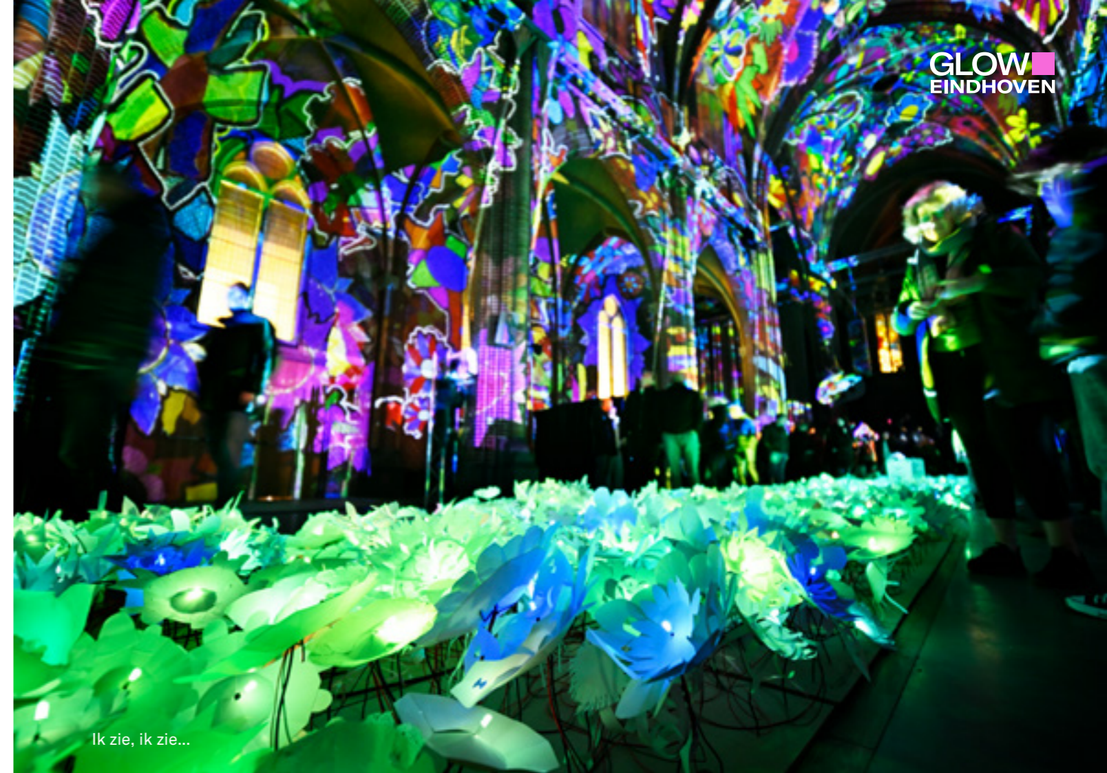
Ik zie, ik zie...

GLOW streeft ernaar om met het vieren van Diwali alle culturen in Eindhoven en omgeving een thuisgevoel te geven. Het lichtfestival is toegankelijk voor iedereen en biedt ruimte aan iedereen. Met het inclusief maken van verschillende culturele vieringen zoals Diwali, wil GLOW een diverse en gastvrije sfeer creëren waarin iedereen zich welkom voelt.