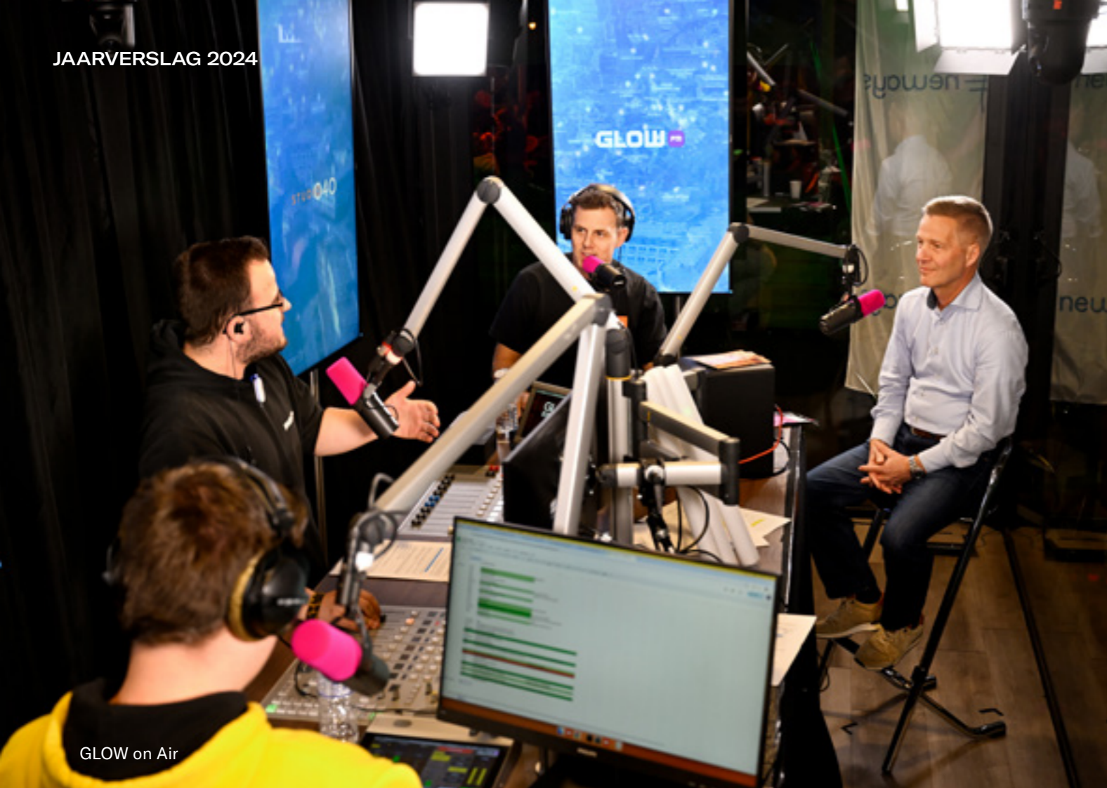
GLOW on Air